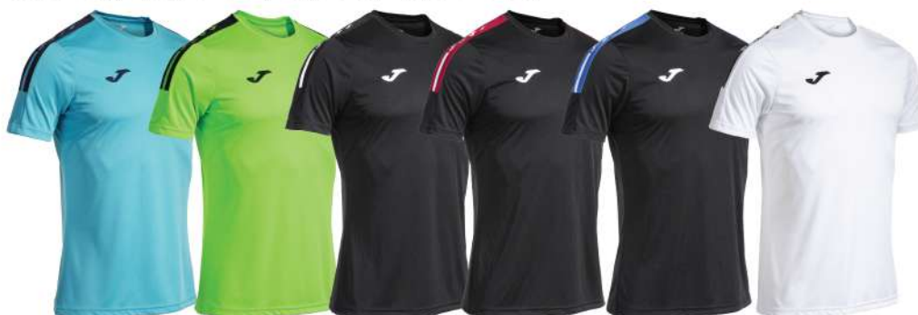
CELESTE/BLU NAVY VERDE FLUO/NERO NERO/BIANCO NERO/ROSSO NERO/BLU ROYAL BIANCO/NERO