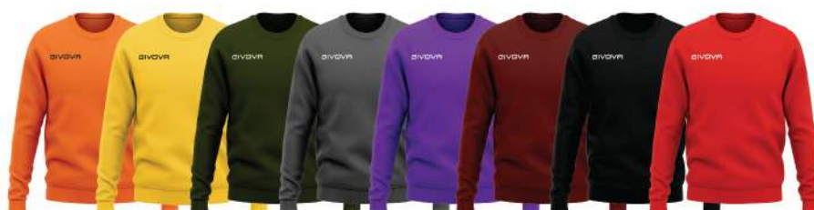
ARANCIO GIALLO SCURO VERDE MILITARE GRIGIO VIOLA GRANATA NERA ROSSA