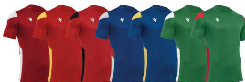
ROSSO/BIANCO ROSSO/GIALLO ROSSO/NERO BLU ROYAL/BIANCO BLU ROYAL/GIALLO VERDE/BIANCO VERDE/ROSSO

Inserti in mesh sui fianchi Girocollo in costina Uomo/Donna/Bambino Taglia 3XS alla 3XL