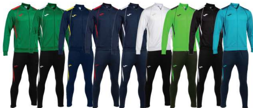
VERDE/ROSSO VERDE/BIANCO BLU NAVY/GIALLO BLU NAVY/ROSSO BLU NAVY/BIANCO BIANCO/GRIGIO VERDE FLUORO/NERO NERO/BIANCO AZZURRO/BLU NAVY

Tessuto interno in pile Vita bassa con zip Design a colori contrastanti Libertà di movimento 100% Poliestere Uomo/Donna/Bambino