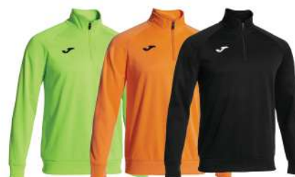
VERDE FLUO ARANCIO NERO

Zip fino al petto Fondo e polsini a costine Collo alto Tessuto confortevole Tessuto interno in pile Libertà di movimento 100% Poliestere Uomo/Donna/Bambino