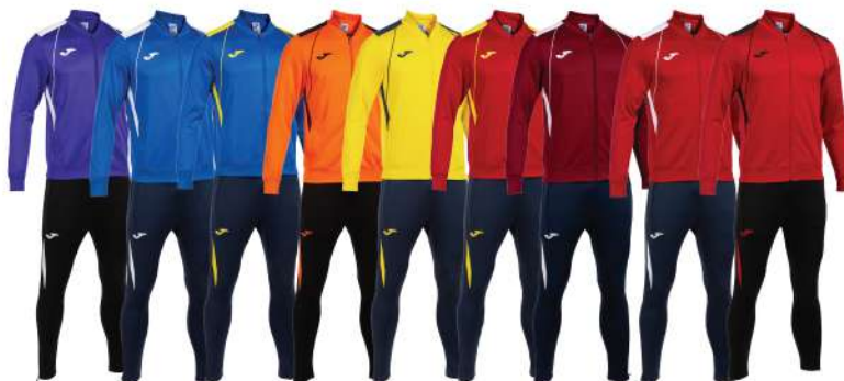
VIOLA/BIANCO BLU ROYAL/BIANCO BLU ROYAL/GIALLO ARANCIO/NERO GIALLO/BLU NAVY ROSSO/GIALLO GRANATA/BIANCO ROSSO/BIANCO ROSSO/NERO