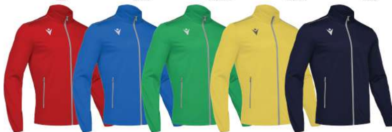
ROSSO BLU ROYAL VERDE GIALLO BLU NAVY

100% Poliestere Uomo/Donna/Bambino Taglia dalla 3Xs alla 3XL