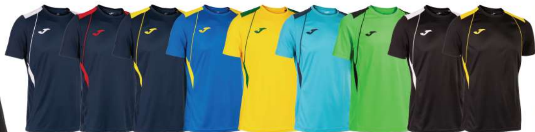
BLU NAVY/BIANCO BLU NAVY/ROSSO BLU NAVY/GIALLO BLU ROYAL/GIALLO GIALLO/VERDE CELESTE/BLU NAVY VERDE/NERO NERO/BIANCO NERO/GIALLO