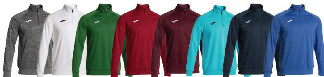
GRIGIO BIANCA VERDE ROSSO GRANATA CELESTE BLU NAVY BLU ROYAL

Zip fino al petto Fondo e polsini a costine Collo alto Tessuto confortevole Tessuto interno in pile Libertà di movimento 100% Poliestere Uomo/Donna/Bambino