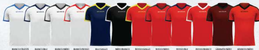
BIANCO/CELESTE BIANCO/BLU BIANCO/NERO BIANCO/ROSSO BLU/GIALLO NERO/BIANCO ROSSO/GIALLO ROSSO/NERO ROSSO/BLU ROSSO/BIANCO GRANATA/NERO AGRANCO/NERO