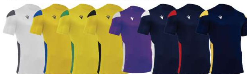
BIANCO/GRIGIO GIALLO/BLU GIALLO/VERDE GIALLO/NERO VIOLA/BIANCO BLU NAVY/BIANCO BLU NAVY/ROSSO BLU NAVY/GIALLO