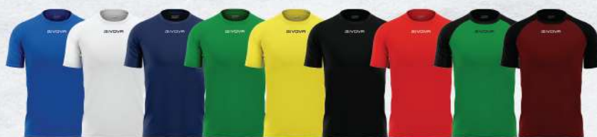
AZZURRO BIANCO BLU VERDE GIALLO NERO ROSSO VERDE/NERO GRANATA/NERO