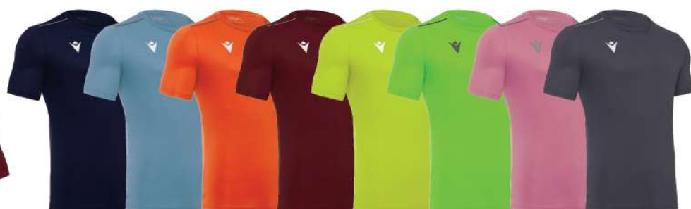
BLU NAVY CELESTE ARANCIO GRANATA GIALLO FLUO VERDE ROSA GRIGIO