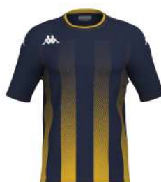
BLU NAVY/ GIALLO