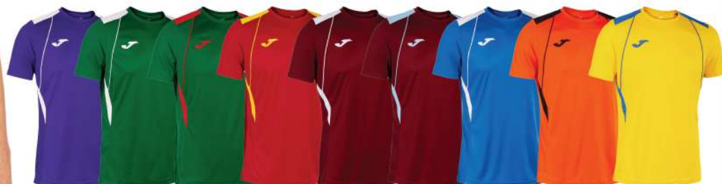
VIOLA/BIANCO VERDE/BIANCO VERDE/ROSSO ROSSO/GIALLO GRANATA/BIANCO GRANATA/CELESTE BLU ROYAL/BIANCO ARANCIO/NERO GIALLO/BLU ROYAL