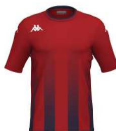
ROSSO/ BLU NAVY