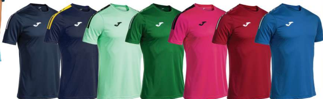
BLU NAVY/BIANCO BLU NAVY/GIALLO VERDE ACQUA/BIANCO VERDE/BIANCO FUXIA/NERO ROSSO/BIANCO BLU ROYAL/BIANCO

Tessuto confortevole Senza cuciture sulle spalle Fatto con poliestere riciclato 100% Poliestere Uomo/Donna/Bambino