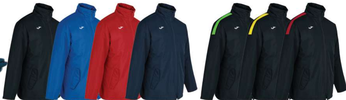
NERO BLU ROYAL ROSSO BLU NAVY NERO/VERDE NERO/GIALLO NERO/ROSSO