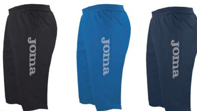
NERO BLU ROYAL BLU NAVY

Fascia elastica Tessuto confortevole Libertà di movimento 100% Poliestere Uomo/Donna/Bambino