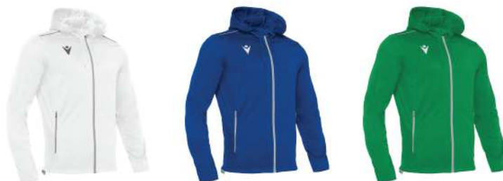
BIANCO BLU ROYAL VERDE