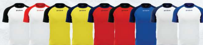
BIANCO/NERO BIANCO/ROSSO GIALLO/NERO GIALLO/BLU ROSSO/BLU ROSSO/NERO AZZURRO/BLU BIANCO/BLU BIANCO/AZZURRO

SHIRT INTERLOCK CAPO MC 100% POLIESTERE INTERLOCK , 140 GRAMS UOMO/DONNA/BAMBINO TAGLIA DALLA 3XS ALLA 3XL