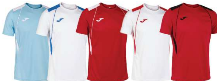
AZZURRO/BIANCO BIANCO/BLU ROYAL ROSSO/BIANCO BIANCO/ROSSO ROSSO/NERO

Tessuto leggero, traspirante e comodo Design a colori contrastanti Libertà di movimento 100% Poliestere Uomo/Donna/Bambino