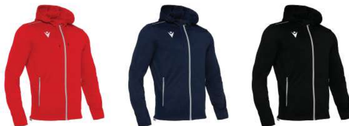
ROSSO BLU NAVY NERO

100% Poliestere Uomo/Donna/Bambino Taglia dalla 3Xs alla 3XL