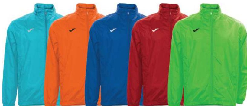
CELESTE ARANCIO BLU ROYAL ROSSO VERDE