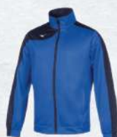
BLU ROYAL/BLU NAVY

100% poliestere Tessuto tricot leggero e garzato Giacca con design asimmetrico con dettaglio in contrasto. Pantalone con 2 tasche laterali zip e polsino in fondo. uomo/donna (XS-3XL) bambino (S-2XL)