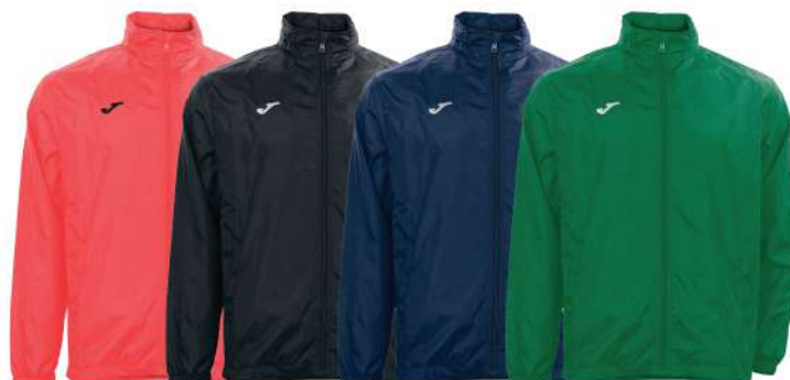
CORALLO NERO BLU NAVY VERDE SCURO

Giacca a vento Impermeabile 100% Poliestere Uomo/Donna/Bambino