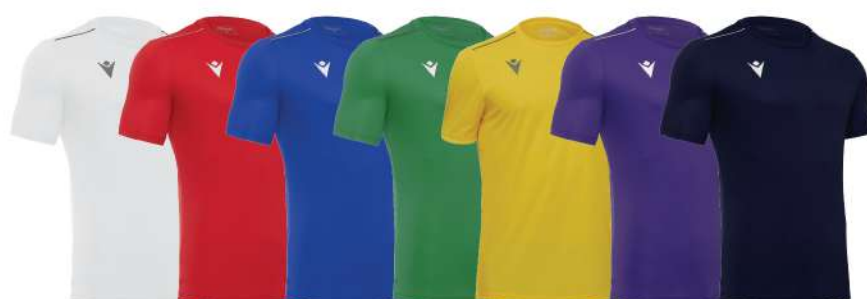
BIANCO ROSSO BLU ROYAL VERDE GIALLO VIOLA NERO

Piping su spalla Girocollo in costina Uomo/Donna/Bambino Taglia dalla 3XS alla 3XL