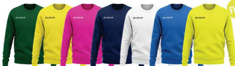
VERDE GIALLO FUXIA BLU BIANCO AZZURRO GIALLO FLUO