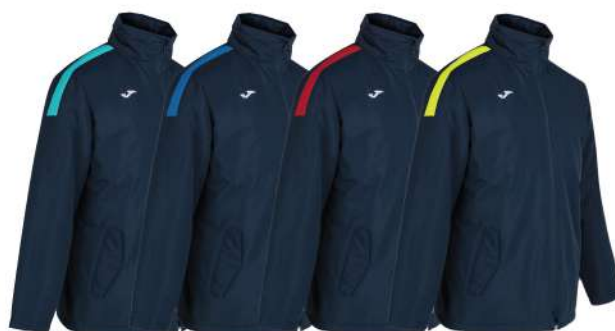
BLU NAVY/CELESTE BLU NAVY/BLU ROYAL BLU NAVY/ROSSO BLU NAVY/GIALLO

Impermeabile 100% Poliestere Uomo/Donna/Bambino