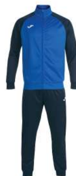
BLU NAVY/BLU ROYAL