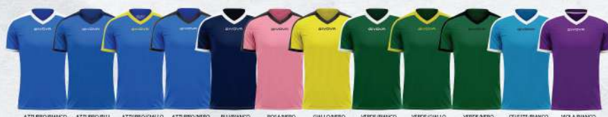
AZZURRO/BIANCO AZZURRO/BLU AZZURRO/GIALLO AZZURRO/NERO BLU/BIANCO ROSA/NERO GIALLO/NERO VERDE/BIANCO VERDE/GIALLO VERDE/NERO CELESTE/BIANCO VIOLA/BIANCO

100% poliestere interlock; Collo in interlock; Logo ricamato; Giromanica in interlock; UOMO/DONNA/BAMBINO TAGLIA DALLA 3XS ALLA 3XL