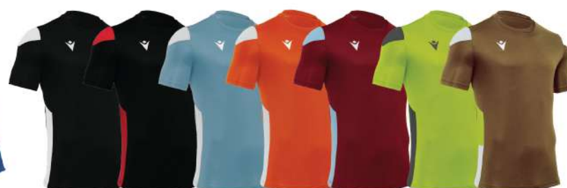
NERO/BIANCO NERO/ROSSO CELESTE/BIANCO ARANCIO/BIANCO GRANATA/CELESTE VERDE/GRIGIO ORO/BIANCO