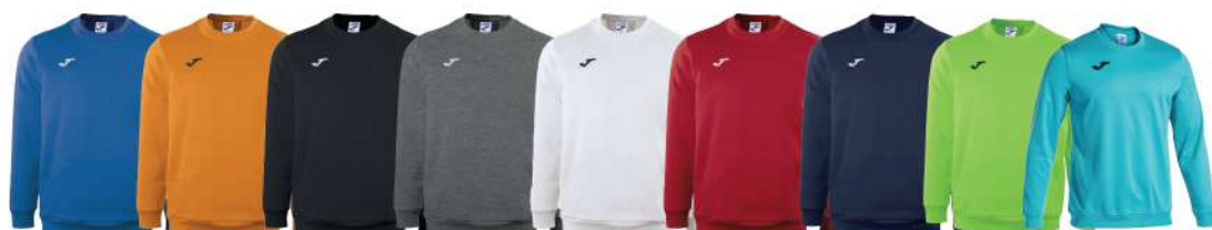
BLU ROYAL ARANCIO NERO GRIGIO BIANCO ROSSO BLU NAVY VERDE FLUO CELESTE

Fondo e polsini a costine Collo a costine Tessuto interno in pile Libertà di movimento 100% Poliestere Uomo/Donna/Bambino