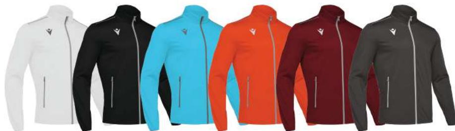
BIANCO NERO AZZURRO ARANCIONE GRANATA GRIGIO